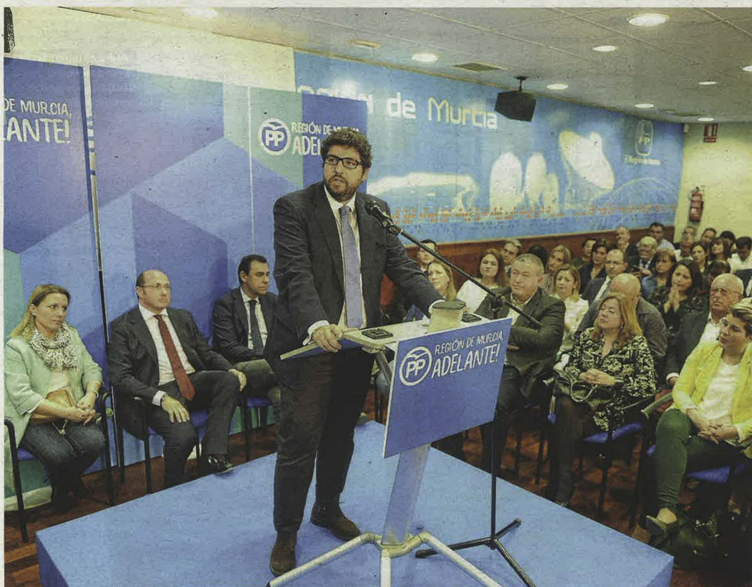
Fernando López Miras, durante su intervención en la Junta Directiva del PP regional.