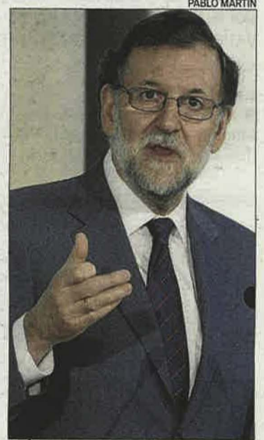
Rajoy, ayer en un acto.

ridad Social y del Instituto Nacional de la Seguridad Social. A la salida de ese acto, no hizo declaraciones. En una breve conversación informal se ha limitado a destacar que era un gran día por los datos de reducción del paro y afiliación a la Seguridad Social en marzo, y a mostrar su convencimiento de que llegarán en este aspecto días mejores. Fuentes del Gobierno subrayaron que, más allá de lo noticioso que reconocen que es la dimisión de Sánchez, lo que más le importa a los españoles son esos datos relativos a la creación de empleo.